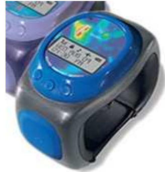
Orologio GPS "dove sei" per bimbi, gadget USA.