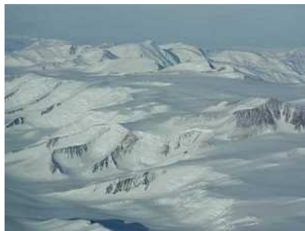
85°S 165°W Antartide, a sud della base di Mc Murdo.

IL GPS FUNZIONA OVUNQUE, ANCHE NEGLI ANGOLI PIU' REMOTI DELLA TERRA