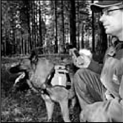
"Fido" hi-tech? Con il GPS ovviamente, meglio del guinzaglio!

Mambo e Twig Locator, due localizzatori GPS/GSM hi-tech di fine 2006 dalle dimensioni di poco superiori ad un portachiavi e dal contenuto tecnologico sorprendente.