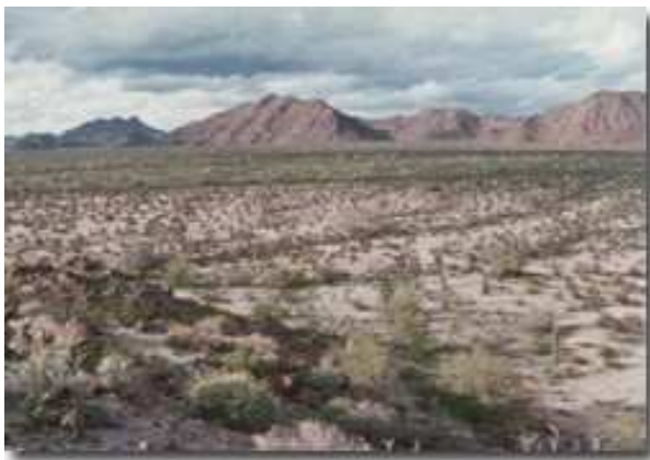
34°N 108°W Deserto dell'Arizona