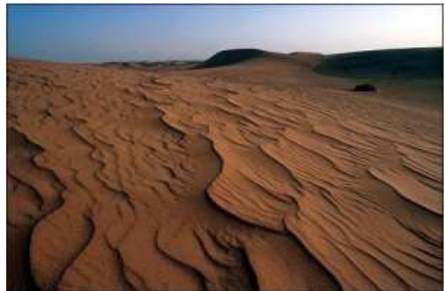
25°S 15°E Deserto della Namibia