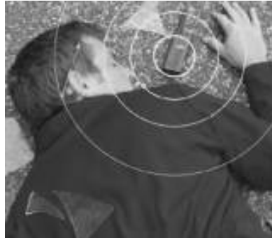
GPS per la sicurezza personale.